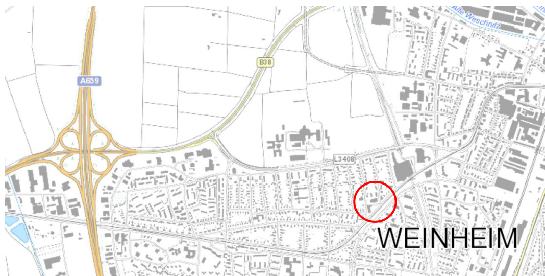
Übersichtsplan Lage Planungsgebiet

Das Planungsgebiet liegt innerhalb eines in den 1950er Jahren entwickelten Baugebietes südwestlich des historischen Stadtzentrums. Das Baugebiet ist von einem regelmäßigen Nord-Süd verlaufenden Straßenraster mit vergleichsweise großen Grundstückstiefen von etwa 70 m geprägt. Hierdurch ergeben sich durch die straßenbegleitende Bebauung stark durchgrünte Innenflächen. Eine Ausnahme bildet das Planungsgebiet, welches baulich von der markanten Marienkirche geprägt ist. Nördlich der Marienkirche befinden sich drei Nord-Süd ausgerichtete Gebäude.